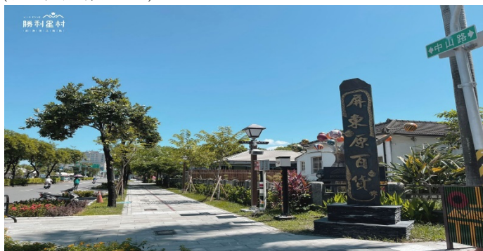
(取自勝利星村官方FB)